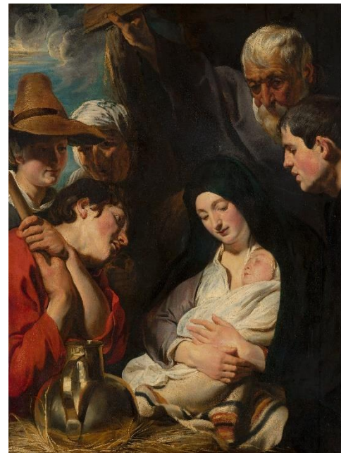
Jacob Jordaens 1617, Mauritshuis