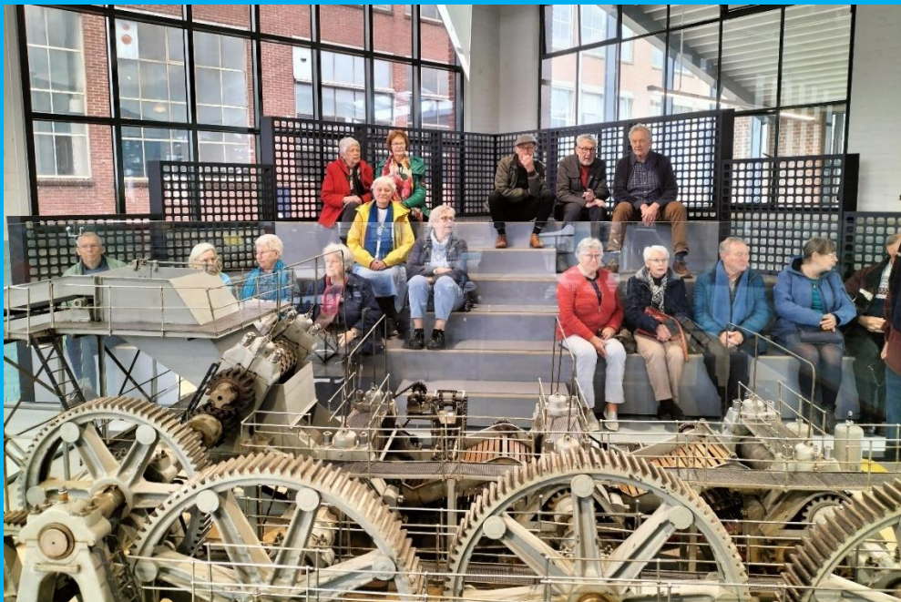
KBO/PCOB-bezoek aan Oyfo Techniekmuseum Heim